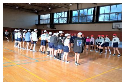
【お別れ交流会の様子】

卒業に向けた取組として、5・6年生対抗でドッジボールとリレーで競い合う「お別れ交流会」を2月26日に行いました。残念ながら雨天のためリレーは中止となりましたが、会の運営や練習に取り組む姿勢を通して5年生は6年生から学ぶところが多くあったようです。