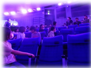
プラネタリウム学習